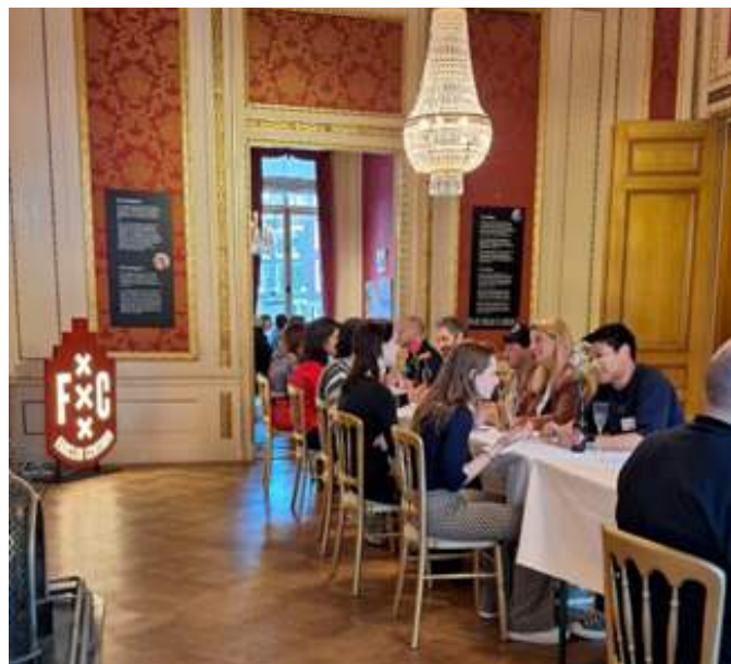
Speeddaten in het Grachtenmuseum ism FC Centrum