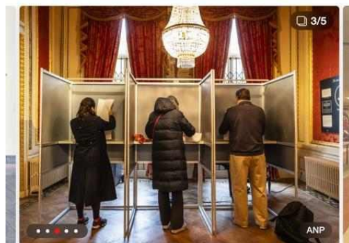
Mensen brengen hun stem uit in het Grachtenmuseum in Amsterdam